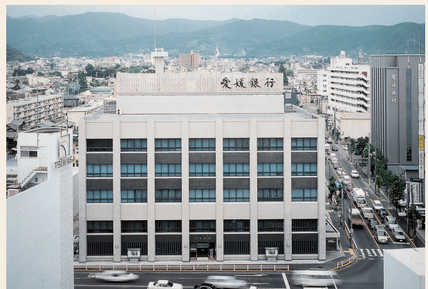
写真：本社社屋と研修所

名 称 株式会社 愛媛銀行 (The Ehime Bank, Ltd.) 所在地 愛媛県松山市勝山町2丁目1番地 創 業 大正4(1915)年 資 本 金 213億67百万円 預 金 等 2兆6,105億円 貸 出 金 1兆9,331億円 店 舗 数 110店舗(本支店98、出張所12) 行 員 数 1,290名